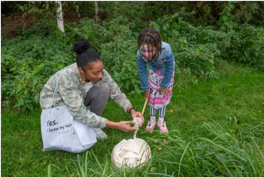
Op kleine beestjes safari onder begeleiding van IVN Leidse regio tijdens het Kidsproof Buitenbeestfeest in Park Matilo